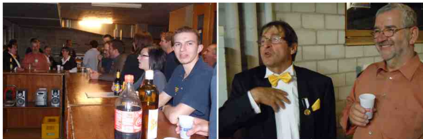
Après le concert, on fête les médailles en chantant