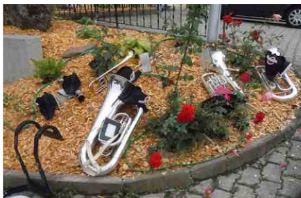
Fête-Dieu du 23 juin 2011