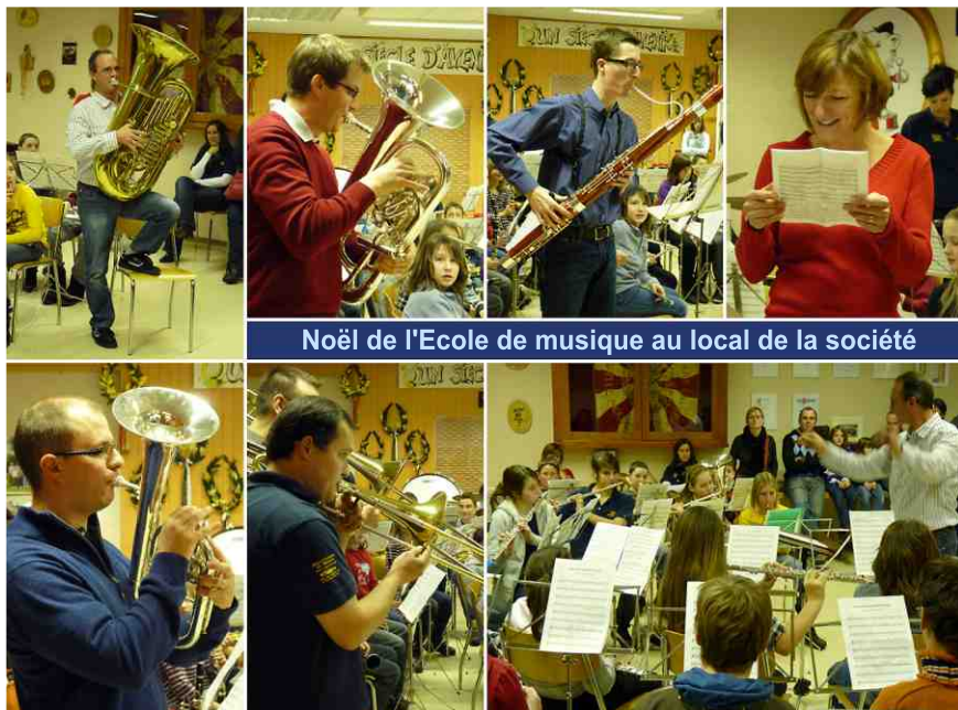
Noël de l'Ecole de musique au local de la société